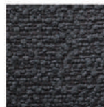
▲ Poodle grey

* Poodle pate & grey (ポリエステル) 近年ファッションアイテムの間でも人気の「Boucle」(ブークレ)生地。フランス語で“輪”という意味で、表面に輪状の糸(ループ)が出るよう加工されています。モコモコした肌触りや見た目からフェミニンで暖かい印象を感じさせるテキスタイルです。