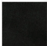
▲ Storm coal