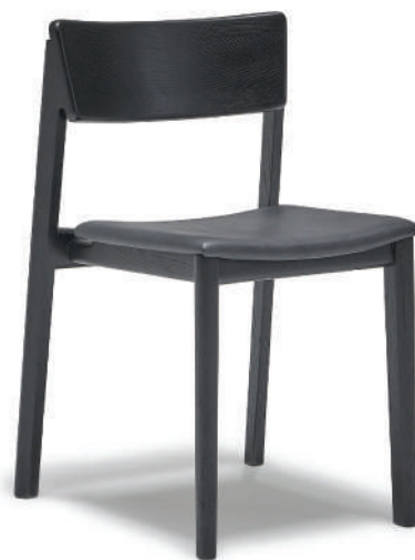
▲ black+montana 1048 coal (leather2) ※在庫色