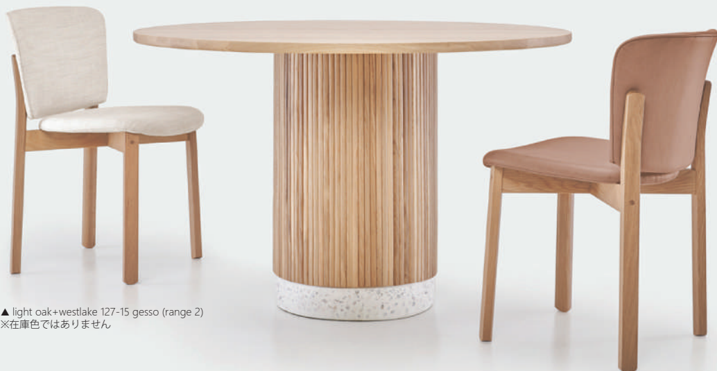
▲ light oak+westlake 127-15 gesso (range 2) ※在庫色ではありません

どこか柔和な雰囲気も醸し出す、シャープさと柔らかさとの絶妙なバランスを取ったチェア。 幅広の座面と背中にフィットする背もたれラインで長時間でもゆったりと快適に着座姿勢を保つことができます。