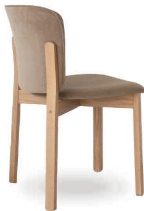
▲ light oak+nano-suede 03 clay (range NS) ※在庫色ではありません