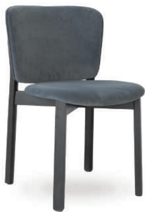
▲ black+nano-suede 13 pitch (range NS) ※在庫色